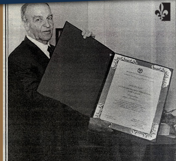
Izetbegović: Sarajevo je za svijet grad tolerancije i slobode