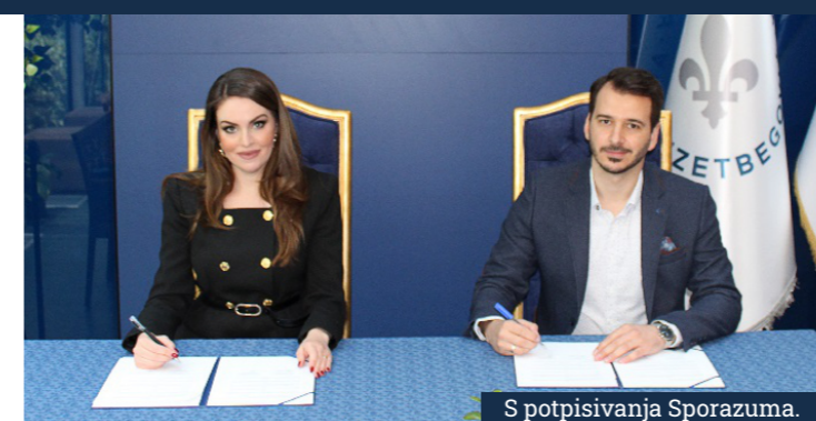
S potpisivanja Sporazuma.

JU Muzej "Alija Izetbegović" i Fondacija "Alija Izetbegović" potpisali Sporazum o saradnji