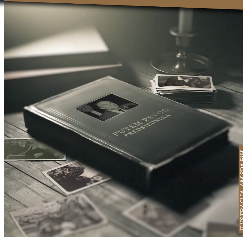
ILUSTRACIJA: AM SDA BiH

Nova web-stranica Muzeja „Alija Izetbegović“ pokrenuta je u cilju blagovremenog obavještanja javnosti o našim aktuelnim projektima i novostima. Našu novu stranicu možete posjetiti na: www.muzejalijaizetbegovic.ba .