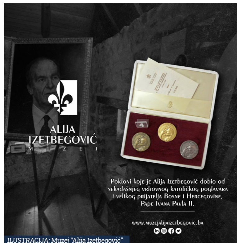
Pokloni koje je Alija Izetbegović dobio od nekadašnjeg vrhovnog katoličkog poglavara i velikog prijatelja Bosne i Hercegovine, Pape Ivana Pavla II.

Među eksponatima u stalnoj muzejskoj postavci nalaze se i pokloni koje je Alija Izetbegović dobio od nekadašnjeg vrhovnog katoličkog poglavara i velikog prijatelja Bosne i Hercegovine, Pape Ivana Pavla II.