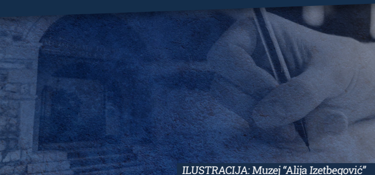
ILUSTRACIJA: Muzej „Alija Izetbegović“