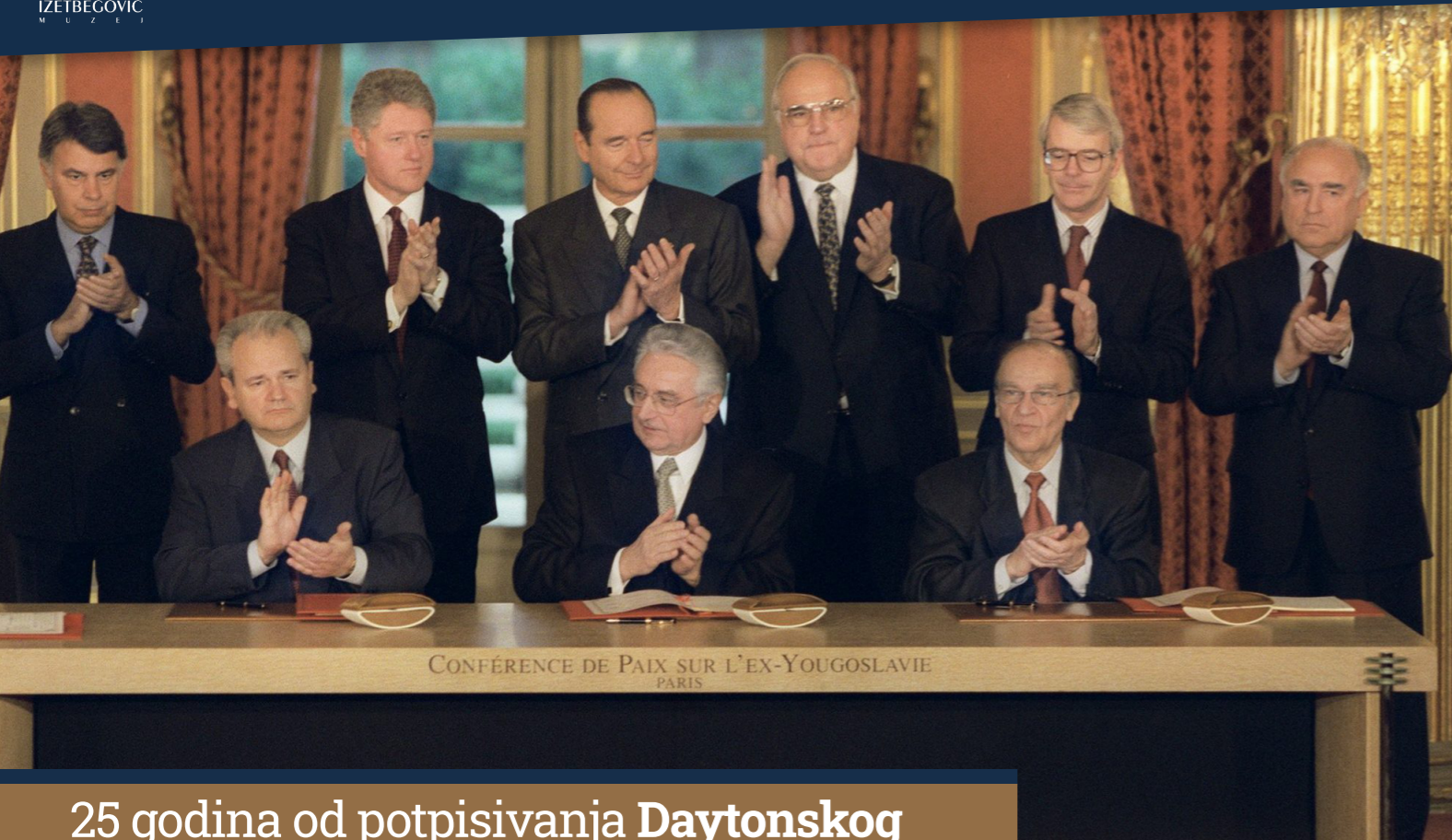
CONFÉRENCE DE PAIX SUR L'EX-YOUGOSLAVIE PARIS