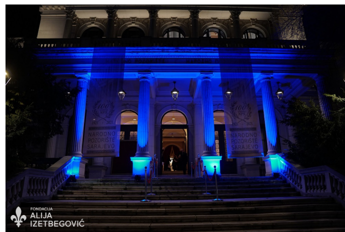
FONDACIJA ALIJA IZETBEGOVIĆ

Svečana akademija održana je uz prisustvo ograničenog broja zvanica u skladu sa mjerama Kriznog štaba Federacije Bosne i Hercegovine, a prisustvovali su joj visoki bh. zvaničnici i članovi diplomatskog kora.